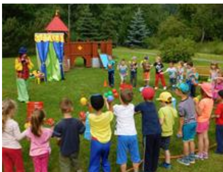
3. díl divadla

S dětmi je pracováno formou seriálových divadelních představení a pohybových aktivit s loutkou Cepíkem. V průběhu celého projektu jsou navíc pro děti připraveny pomůcky a materiály opět s tematikou zdravého životního stylu.