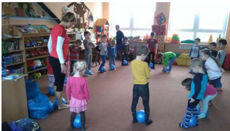
Cvičení v rámci projektu Cepík 2

Ze studie, která byla provedena se Zdravotním ústavem v Ústí nad Labem vyplynulo významné procento dětí, u kterých se objevují oslabené horní končetiny, šikmá pánev a minimální aktivita chodidel. Proto byla pro předškolní děti vytvořena brožura s cviky, která vychází z metody spinální dynamiky. Tyto cviky se cvičí buď samostatně, nebo pomocí softbalů. Při pravidelném cvičení bylo studii prokázáno až 30% zlepšení stavu. V Ústeckém kraji byl projekt pilotně ověřován v 5ti mateřských školách. Každý měsíc do škol dojížděla fyzioterapeutka, která s dětmi cvičila. Ve zbylém čase měly s dětmi cvičit paní učitelky. Projekt nebyl ke konci roku 2016 ještě ukončen.