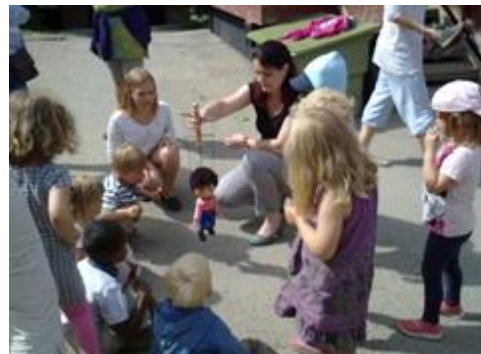
Cepík v Norské školce.

V roce 2016 bylo do projektu Cepík celkově zahrnuto 15 mateřských škol v Ústeckém kraji a 20 mateřských škol v Pardubickém kraji a v Královéhradeckém kraji.